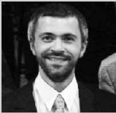
講師 パーヴェル・ネルセシヤン (国立モスクワ音楽院ピアノ科教授)

世界の有名なコンクールに数々の上位入賞者を輩出。ピアニストとしても一流であり、ラフマニノフを中心とするロシアの作曲家作品をはじめベートーヴェン等ドイツロマン派の演奏に定評がある。世界各国でコンサート活動及びマスタークラスの講師として招かれるほか、チャイコフスキー国際コンクール、ショパン国際コンクール等の審査員を務める。旧ソ連邦功労芸術家の称号を持つ。