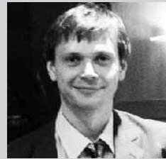
講師 アンドレイ・ピサレフ (国立モスクワ音楽院ピアノ科助教授)

1964年モスクワ生れ。85年ベートーヴェン国際コンクール2位、91年ダブリン国際コンクール優勝。ロシア国内だけでなく欧米各地で活動。ダブリン名誉市民に選ばれる。演奏は作曲家の意図を重視する正統的なもので、音色の多彩さとフレージングの美しさは絶品。博識に加え、ユーモアあふれる人柄でオペラにも造詣が深い。