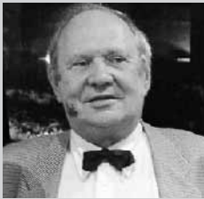
音楽監督／講師 セルゲイ・ドレンスキー (国立モスクワ音楽院ピアノ科教授)

世界の有名なコンクールに数々の上位入賞者を輩出。ピアニストとしても一流であり、ラフマニノフを中心とするロシアの作曲家作品をはじめベートーヴェン等ドイツロマン派の演奏に定評がある。世界各国でコンサート活動及びマスタークラスの講師として招かれるほか、チャイコフスキー国際コンクール、ショパン国際コンクール等の審査員を務める。旧ソ連邦功労芸術家の称号を持つ。